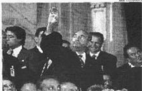
El dictador cubano ayer en el Congreso

El dictador cubano Fidel Castro despierta furor, pero también rechazo entre los legisladores y gobernantes a la candidatura de Riquelme del mando presidencial.