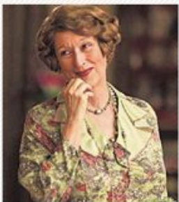
OSCARY 2017 Meryl Streep z 20. nominacją Za „Boską Florence”. Aż 14 szans dla musicalu „La La Land” - s. 16