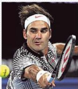
AUSTRALIAN OPEN 18. Szlem Króla Rogera? 35-letni Federer jest o krok od rekordowego triumu - s. 23