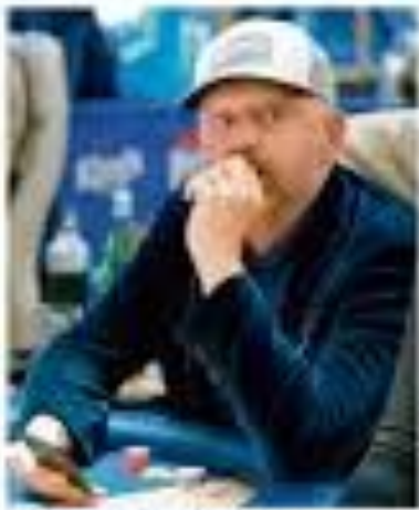
První posádka ČSAD? Rozběhla další novina čina.

První posádka ČSAD? Rozběhla další novina čina První posádka ČSAD? Rozběhla další novina čina. První posádka ČSAD? Rozběhla další novina čina. První posádka ČSAD? Rozběhla další novina čina.