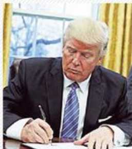
BIALY DOM Trump spełnia obietnice Ameryka wycofuje się z wolnego handlu - s. 2 i 8

Zůstaly 2 dny do premiéry filmu Sztuka Kochania